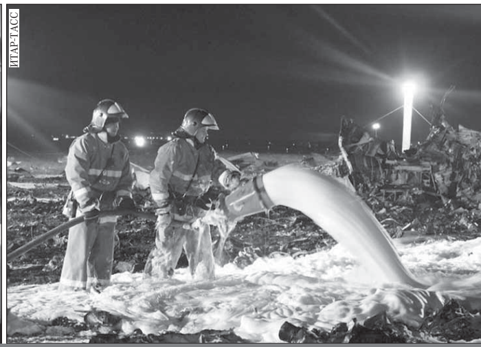
Фиктивные «путевки в небо», выдаваемые учебным центром, не раз приводили к печальным последствиям.