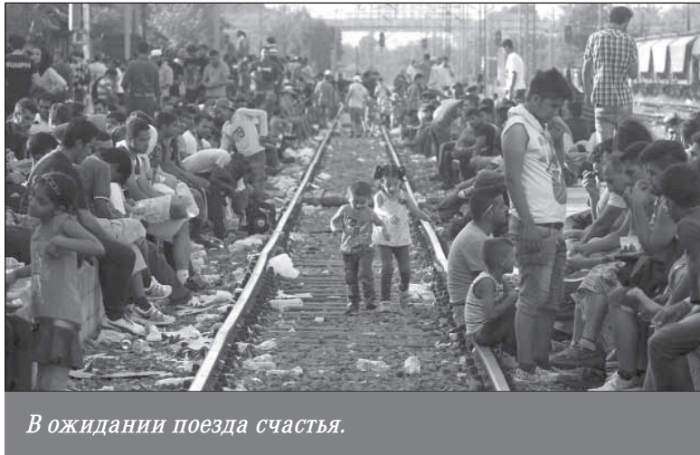
В ожидании поезда счастья.

Самое большое количество из них находится сейчас в Турции: около 3,3 млн. (плюс 400 тысяч по сравнению с январем). Затем следует Египет, где переправы в Европу дожидаются до одного миллиона нелегалов (плюс 0,5 млн.). Такое же количество беженцев «сидит на чемоданах» в Ливии. Правда, в связи с активными действиями местных вла-