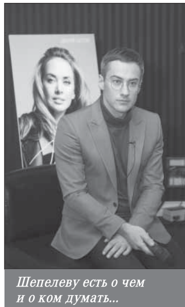
Шепелеву есть о чем и о ком думать...