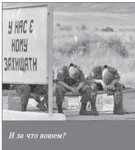
И за что воюем?

В то же время бравировавшие поначалу безграничной смелостью националистические добровольческие полки и батальоны, хотя и числятся в Национальной гвардии, однако действуют автономно