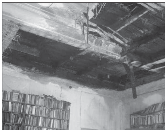
«Русский дом», в который шли и шли люди, не раз поджигали.