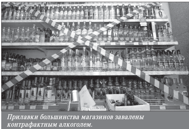
Прилавки большинства магазинов завалены контрафактным алкоголем.

При этом из кожи вон лезут, чтобы производимое кустарным способом пойло не уступало по своему качеству легальному алкоголю. И многие, надо признаться, добиваются своей цели. А так как тенивики не платят акцизы, налоги, то их торговый навар в два-три, и даже в десять раз (если используются отвары трав и красители) превышает доход честных производителей. Вот почему хозяева и малых магазинчиков, и солидных супермаркетов охотно торгуют контрафактом.