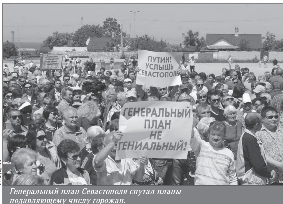
Генеральный план Севастополя спутал планы подавляющему числу горожан.