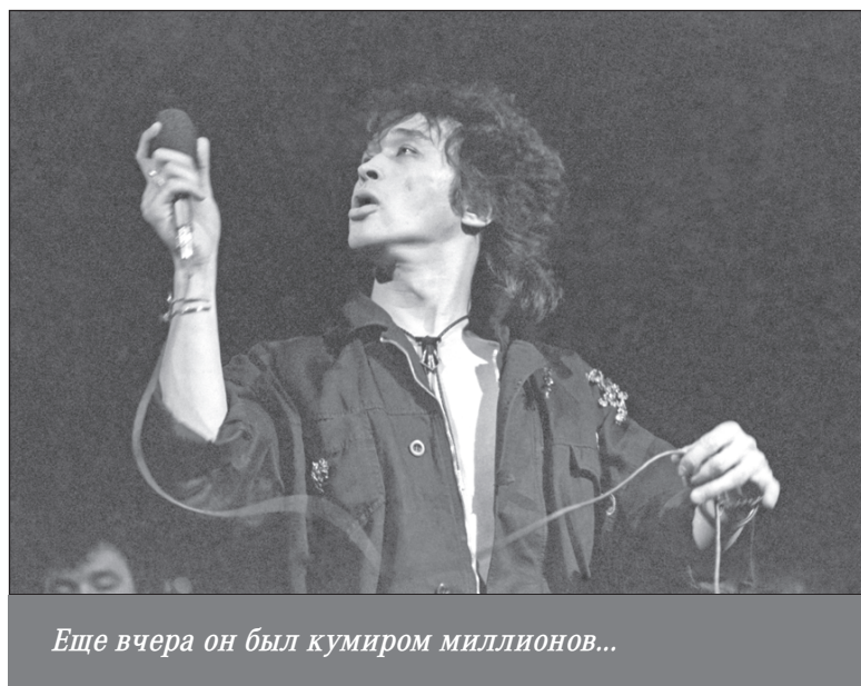
Еще вчера он был кумиром миллионов...

— Меня часто спрашивают, что было бы, если б Виктор был