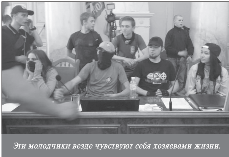
Эти молодчики везде чувствуют себя хозяевами жизни.