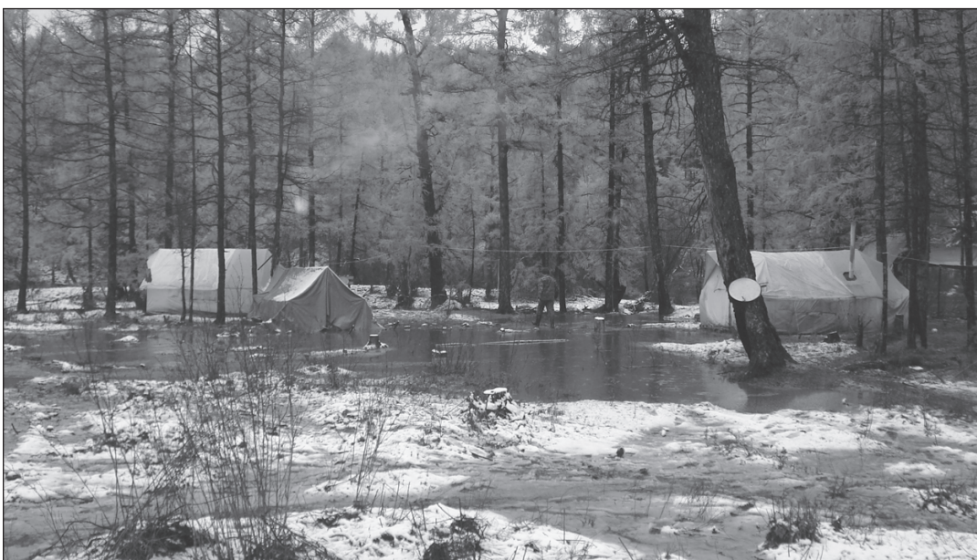
В таких условиях приходится работать геологоразведчикам.