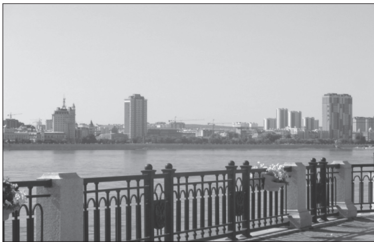
С российского берега Амура китайский город Хэйхэ виден, как на ладони; рынки Благовещенска наводнены соседями Поднебесной и ее товарами.