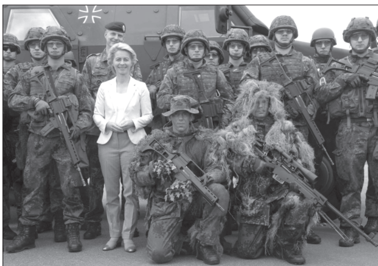
Министр обороны Германии Урсула фон дер Ляйен в группе солдат немецких специальных военно-морских сил в городе Эккернфёрде, Шлезвиг-Гольштейн, 16 июля 2014 года.

Эта уверенность руководства связана с достаточно и стабильным числом тех граждан, кто готов служить в армии по временным контрактам. Их число составило в этом году уже 33 400 человек, что на три процента больше цифр прошлого года.