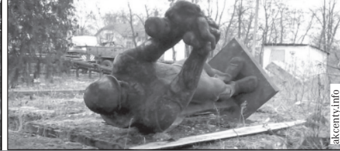
Так расправились с памятниками в Щецине (слева) и в других городах Польши.