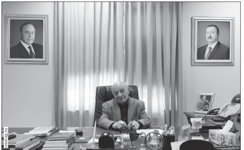
О деятельности неутомимого Омара Гасановича Эльдарова красноречиво рассказывают эти фотографии.

восхищение его человечностью, многогранным талантом, — в полной мере и правдиво отразилось в портретах знаменитого политика мирового масштаба.