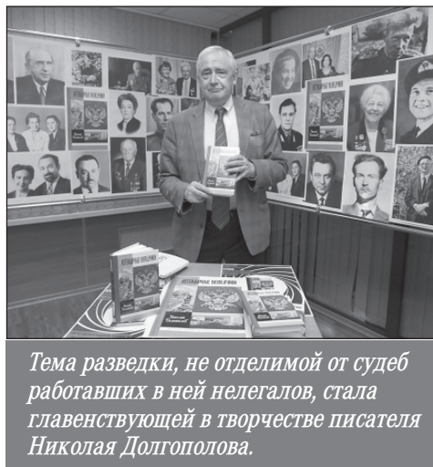
Тема разведки, не отделимой от судеб работавших в ней нелегалов, стала главенствующей в творчестве писателя Николая Долгополова.

То был не просто героический человек — настоящий стоик. В свое время разведка привозила ему сына в одну из стран Западной Европы, куда он выезжал в командировку из своего постоянного места пребывания. Надо было, чтобы мальчик видел,