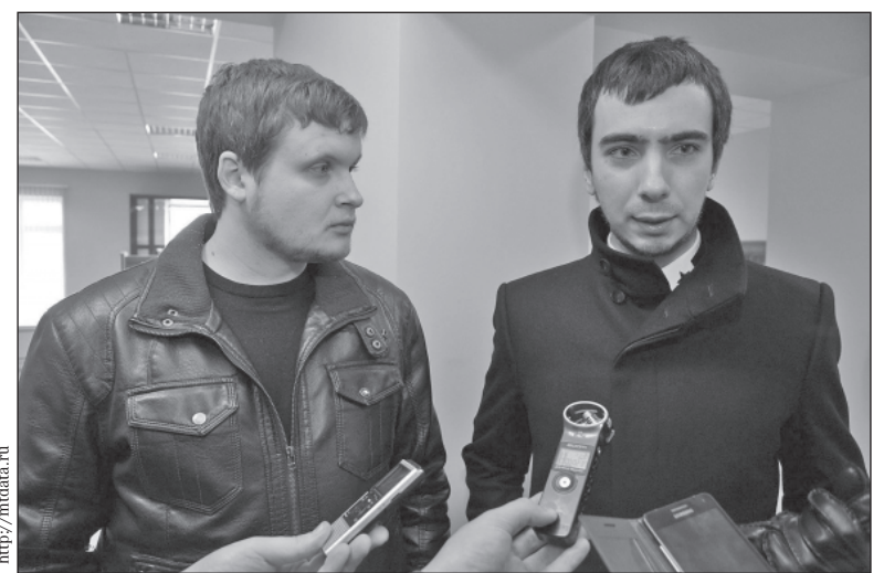
Жанр, в котором они работают, ребята называют «пранк-журналистикой», хотя их методы труда вызывают серьезные сомнения.

Сами ребята называют то, что они делают, методом получения информации, признавая при этом, что он не всегда гарантирует соблюдение общепринятых этических норм. Но пока им все сходит с рук, и даже самый громкий пранк последнего времени — разговор «Владимира Путина»,