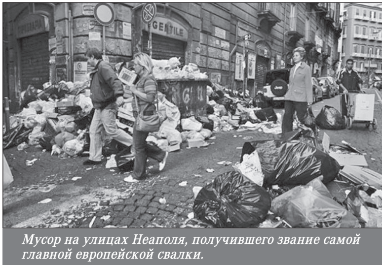
Мусор на улицах Неаполя, получившего звание самой главной европейской свалки.

трудностей. Такие же сообщения приходят из Канады, Ирландии, Германии и ряда других стран. В портовых городах собираются десятки тонн мусора, от которого отказался Китай.