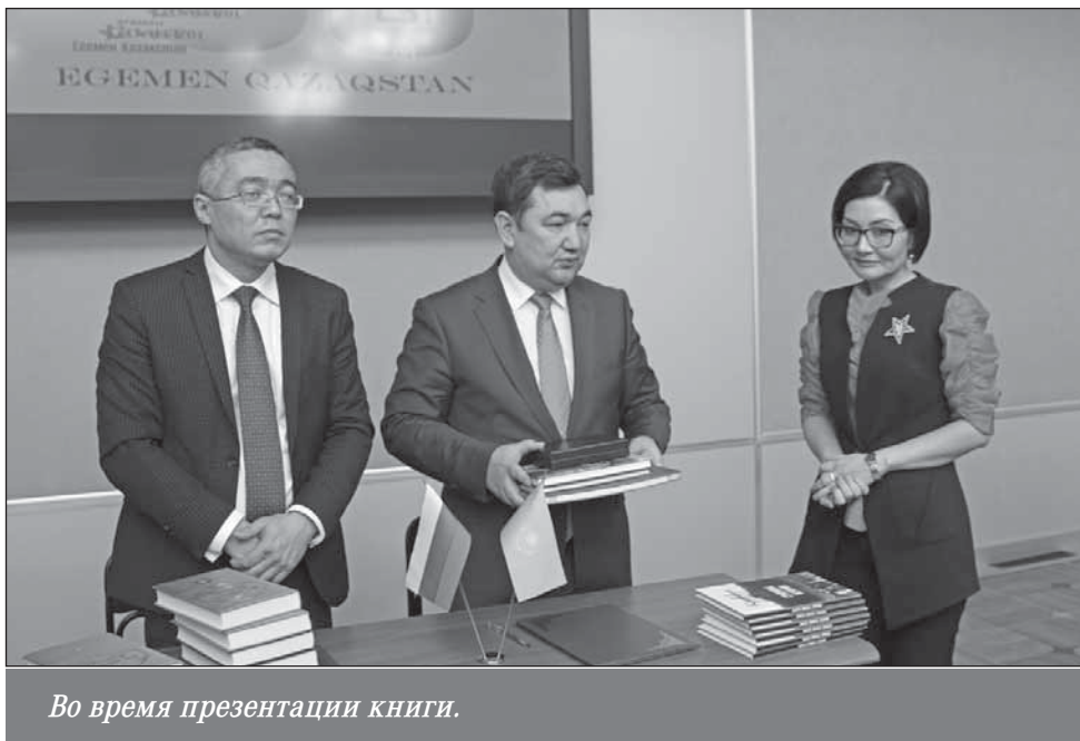
Во время презентации книги.

му и неправому суду, расстреляны и захоронены в общих могилах на территории Москвы и Московской области — на Ваганьковском и Донском кладбищах, Бутовском полигоне и спецобъекте «Коммунарка». «Кровавые страницы